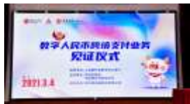
中国首笔跨境数字人民币试点企业