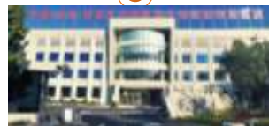
投资运营汕尾市跨境电商产业园区,搭建运营中国（汕尾）跨境电商园区公共服务平台