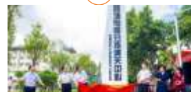
惠阳分拣清关中心 货物申报、查验、扣仓，系统链接海关、场所