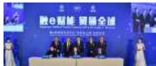
深圳名企馆（深圳贸促委+工行+跨国通）